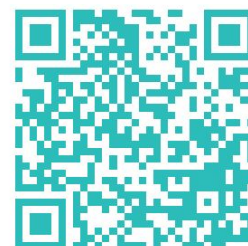
Vidéo du colloque Loire Alerte